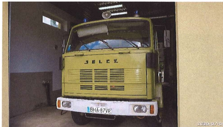
Zdjęcie 1. Widok przodu pojazdu w dniu badania.