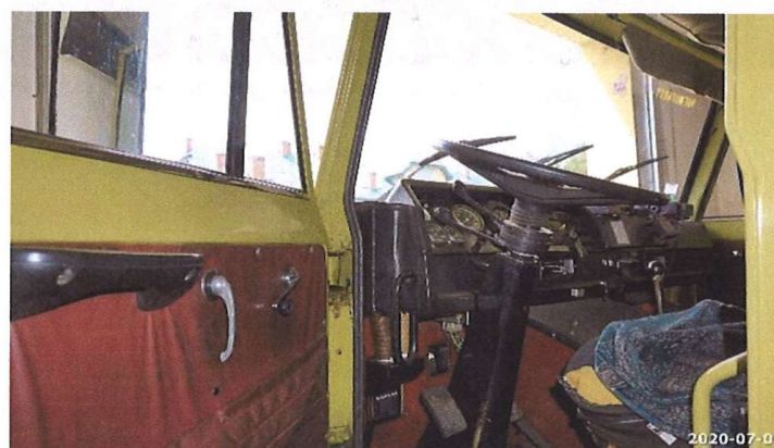
Zdjęcie 3. Widok wnętrza pojazdu.