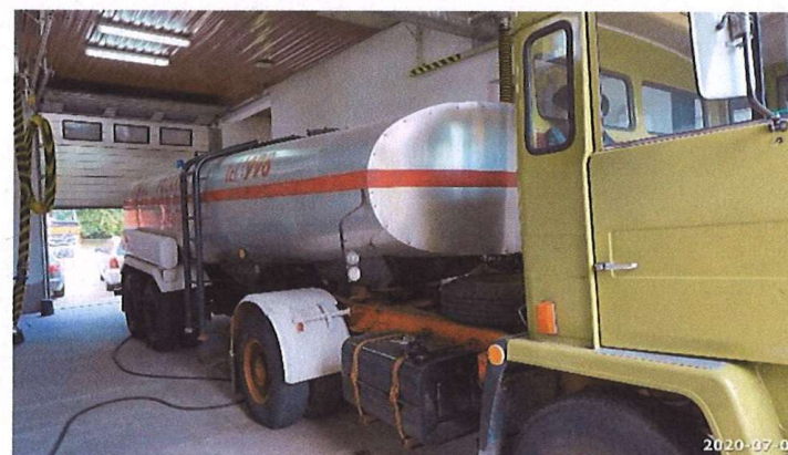
Zdjęcie 2. Widok boku pojazdu.